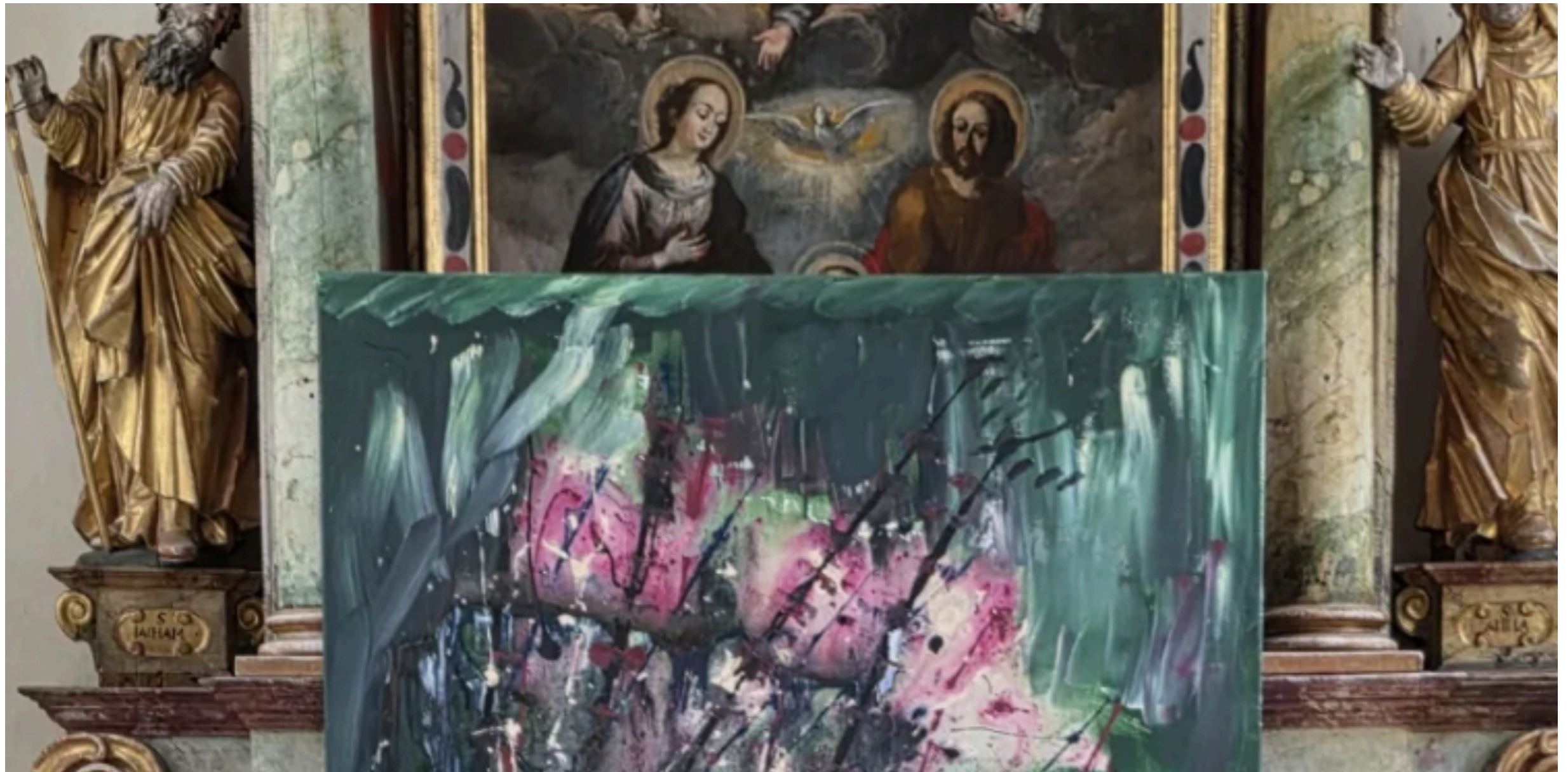
Ausstellung in der Leonhardskapelle in Kollmann, Südtirol

Seit 2022 organisiere ich meine Ausstellungen vollständig eigenständig – von der Konzeptentwicklung über die Auswahl der Werke bis hin zur Gestaltung der Räume und der Öffentlichkeitsarbeit. Ich habe bislang nicht in anerkannten Galerien ausgestellt, weil meine Kunst bewusst außerhalb klassischer Strukturen entsteht. Diese Unabhängigkeit ermöglicht mir eine absolute künstlerische Freiheit: Ich wähle Orte, die zu meiner Arbeit passen, nicht solche, die als „anerkannt“ gelten. So entstanden Ausstellungen in meiner Privatgalerie, in Obstwiesen, in